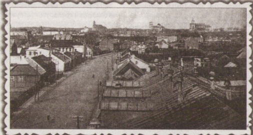
Фото ул. Липовой, сделанное с крыши табачной фабрики до Второй мировой войны