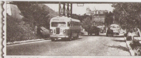
Улица Горновых. 50-е гг.

В доме №17, реконструкция которого завершается, в настоящее время находится Гродненская областная филармония. Ранее долгие годы в здании работал Дворец культуры химиков, возведенный еще в 1974 году. А еще раньше на этом месте